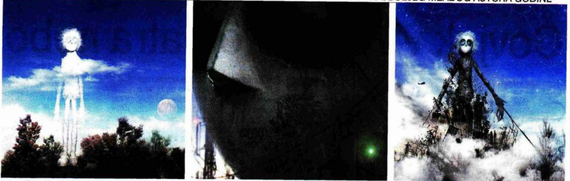
Fotografije iz filma "Guliver"

ZDENKO BAŠIĆ, ILUSTRATOR I ANIMATOR, DOBITNIK ULUPUH-ove NAGRADE ZA NAJBOLJEG MLADOG AUTORA GODINE